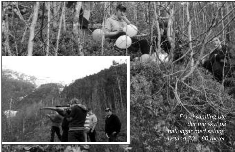
Frå ei samling ute der me skyt på ballongar med salong. Avstand 70 – 80 meter.